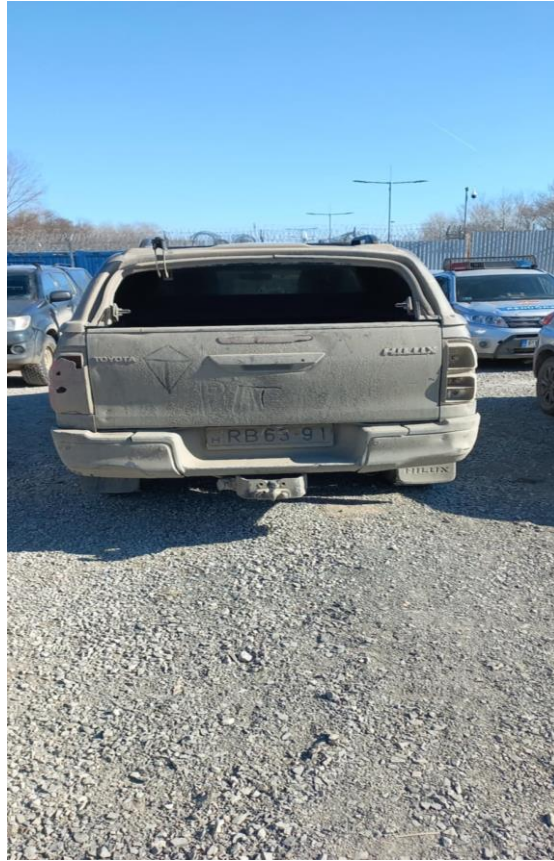
A határvadászok egy megrongált terepjárója

Az embercsempész sofőrök mindenféle nációból verbuválódtak, de az utóbbi időben sok volt közöttük a georgiai és a román állampolgár. Az interjúkból kiderült, hogy a magyar csempészek nem igazán próbálkoznak, mivel ők jóval súlyosabb büntetésekre számíthatnak, mint a külföldiek, akiknek csak az országot kell elhagyniuk – feltéve, ha komolyabb bűncselekményt nem követtek el. 32