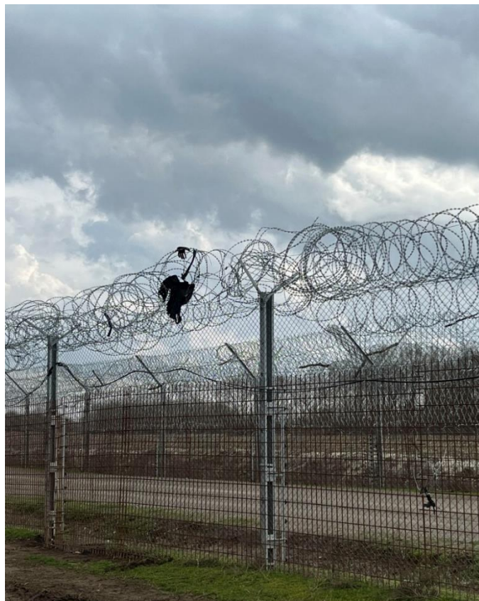
A „kerítésen” akadt ruhafoszlányok

Néhány évvel ezelőtt még alumíniumlétrákon keltek át a legtöbben, azt megelőzően pedig az alagútásás dívott a könnyen ásható, homokos talajban. Utóbbinak a műszaki határzár talajszint alatti megerősítése vetett gátat, míg a létrázás a külső kerítés ipszilon-profilú, úgynevezett hattyúnyakkal történő megerősítését követően szorult háttérbe. Azonban teljes egészében nem hagytak fel a létrák használatával sem, mint arról ottjártunkkor a pengedrótton akadt, fekete ruhafoszlány és gumikesztyű is tanúskodott. 28 Jelenleg a műszaki határzárát legtöbben erővágóval metszik át, ami gyorsabb és biztonságosabb, mint a pengedróttal védett – a hattyúnyak kiépítését követően – négy méternél is magasabb kerítésen átmászni. És még ezután is csak az akadály felénél járnak, hiszen a szervizút mögött a kettős kerítésrendszer másik elemén is át kell jutniuk.