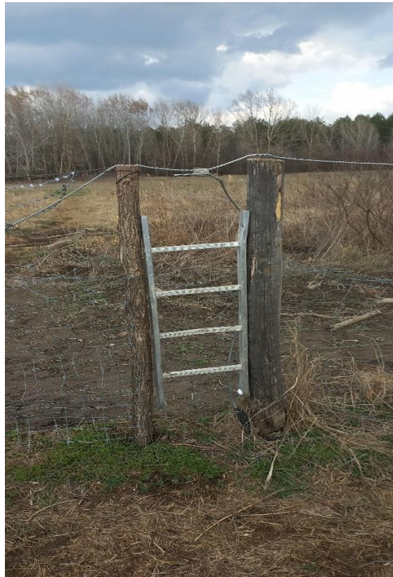
A migránsok által hátrahagyott létra „újrahasznosítása”

szerint az erdős területen gyalogos tempóban haladva nyolc perc alatt lehet átvágni a területen. 29 Ráadásul a fák takarása is megkönnyíti az elrejtőzést. A terület másik végén pedig még sűrűbb erdőkben lehet folytatni az utat. A „Vaddisznóskert” kerítését folyamatosan megrongálták, ami miatt a magyar határrendészek arra kényszerültek, hogy egy, a migránsok által hátrahagyott létradarabot építsenek be két oszlop közé, hogy a további károkat elkerülve, inkább ott haladjanak tovább a bevándorlók.