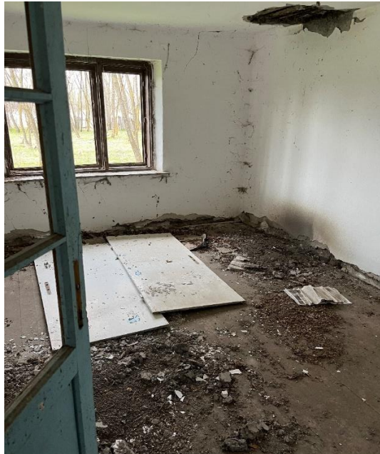
Elhagyott ásványtanyai tanya, ahol gyakran irreguláris bevándorlók húzzák meg magukat.

A migránsok jelentős humanitárius kihívásokkal szembesülnek, beleértve az erőszakot, a kizsákmányolást és a visszaéléseket. Sokan kénytelenek a szabadban vagy elhagyatott épületekben aludni, és folyamatosan gondot okoz az alapvető szolgáltatásokhoz és védelemhez való hozzáférés. 26 Utóbbi megállapításokat a Migrációkutató Intézet elmúlt években végzett terepkutatásai is alátámasztották, sőt, a legutóbbi, Magyarországon belül végzett információgyűjtés is. A helyiek elmondása szerint a bevándorlók rövid időtartamra, de jellemzően romos épületekben húzzák meg magukat, ami Szerbiában sincs másképp.