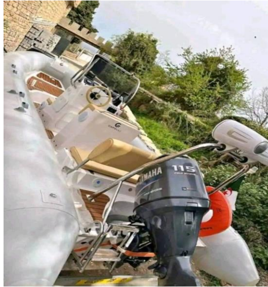
A kép forrása: FACEBOOK 2024c.

Az „Út Európába és Amerikába” nyilvános csoport közzétette egy bevándorló fotóját, aki a sivatagban tartózkodik, majd mellette egy másik képet, amelyen ugyanaz a személy a párizsi Eiffel-torony előtt áll. A poszt szerzője a képek fölé a következő szöveget írta: „ Nem rendelkezem álmanim nőjével, [mivel] az én álmom, hogy eljussak Európába. Most ti jöttök... hamarosan... ha Isten is úgy akarja. Próbálkozz, és eljön az a nap, amikor az álmod valóra válik. ”