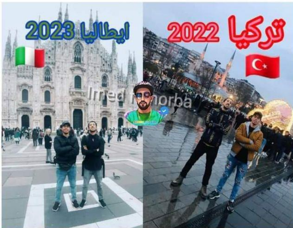
A jobb oldali képen lévő felirat: „Törökország 2022”, míg a bal oldali képen lévő felirat: „Olaszország 2023”. Forrás: FACEBOOK 2023.

Az „Út Európába és Amerikába” nyilvános csoport egy másik posztjának szintén hasonló a célja. Ebben leírják, hogy „ba ez a poszt újra megjelenik, az azt jelenti, hogy hamarosan Olaszországba utazol, barátom. Az álom valóra fog válni, csak ne add fel; ne add fel és ne nézz hátra, [legyen] az álmod a szemed előtt! Ha Isten is úgy akarja, eljön a nap és eljutsz Európába [...]”