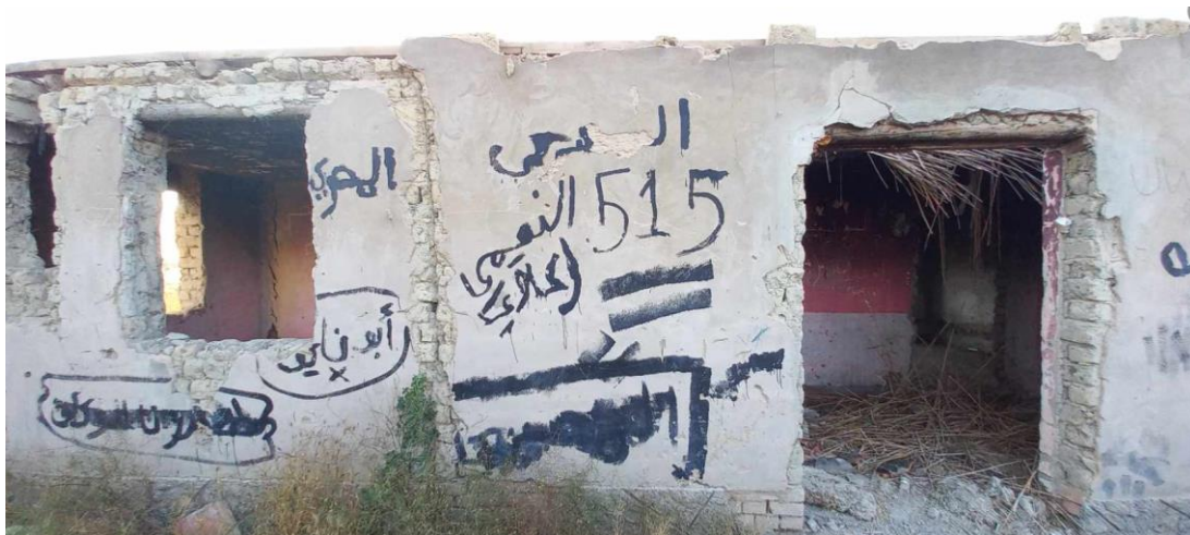
1. fénykép – Dobó Géza

Ezekben a gyakran félig lebontott és romossá lelakott házak túlnyomó részében azonban senki sem takarította el a tavaly ősszel véget ért migránsinvázió nyomait. A mindent elborító szemétkupacok mellett a többnyire neveket tartalmazó arab nyelvű falfirkák teszik egyértelművé, hogy nemrég még illegális bevándorlók húzták meg magukat a környéken.