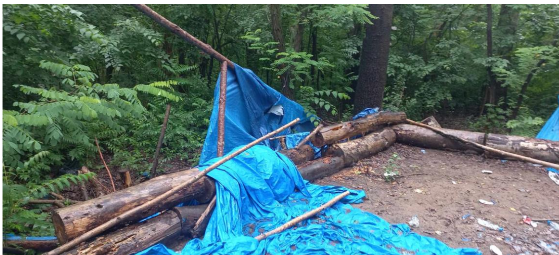
2. fénykép – Dobó Géza

Négy egykori táborhelyet jártunk be, azonban a helybéli kíséző elmondta, hogy jóval több táborhely-rom is fellelhető a helyszínen.