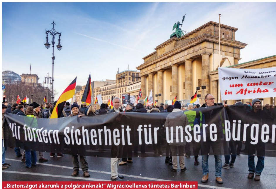
„Biztonságot akarunk a polgárainknak!” Migrációellenes tüntetés Berlinben

kimondanák, hogy nem vesznek át migránsokat a déli tagállamoktól, inkább fizetnek. De északon és nyugaton is hamar ki fog derülni, hogy a paktum sokkal inkább rossz kompromisszum, mint jó megoldás, ez pedig a bevándorlásellenes erők, így a holland Szabadságpárt, a belga Flamand Érdek, a francia Nemzeti Tömörülés és mások támogatottságának további erősödését vagy legalábbis stabilizálódását hozhatja – mutat rá végezetül a szakértő. ■