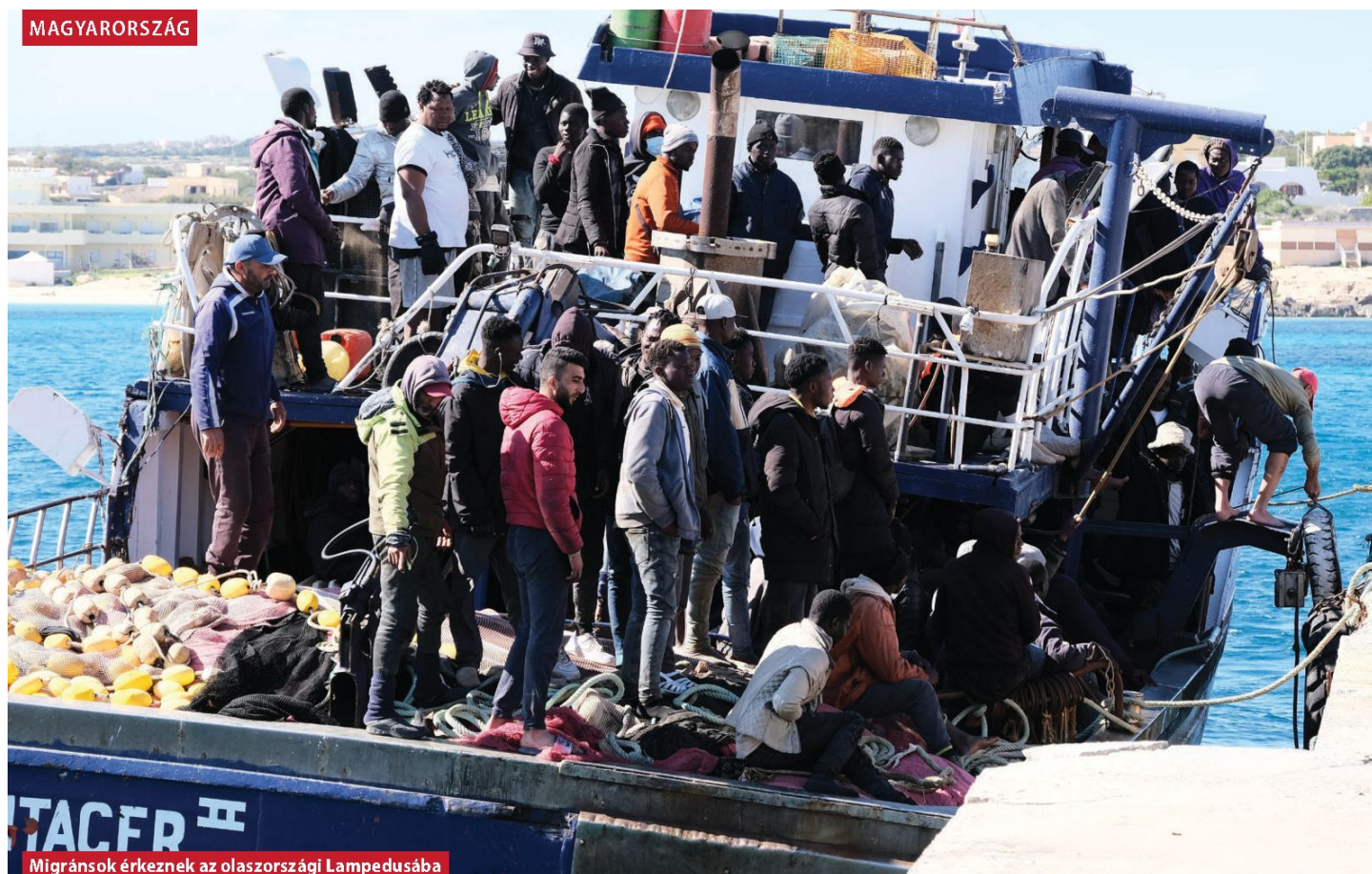
Migránsok érkeznek az olaszországi Lampedusába

ciót menedzselő NGO-k egy része amiatt háborog, hogy a paktum nem védi eléggé a migránsok jogait. A Zöldek a szavazás előtt arról beszéltek, hogy ellenezni fognak bizonyos dokumentumokat, mivel nem védik az alapvető jogokat, Cornelia Ernst , a német baloldali európai parlamenti képviselője pedig egyenesen azt mondta, hogy „ez a paktum a szégyen és a gyalázat paktuma”.