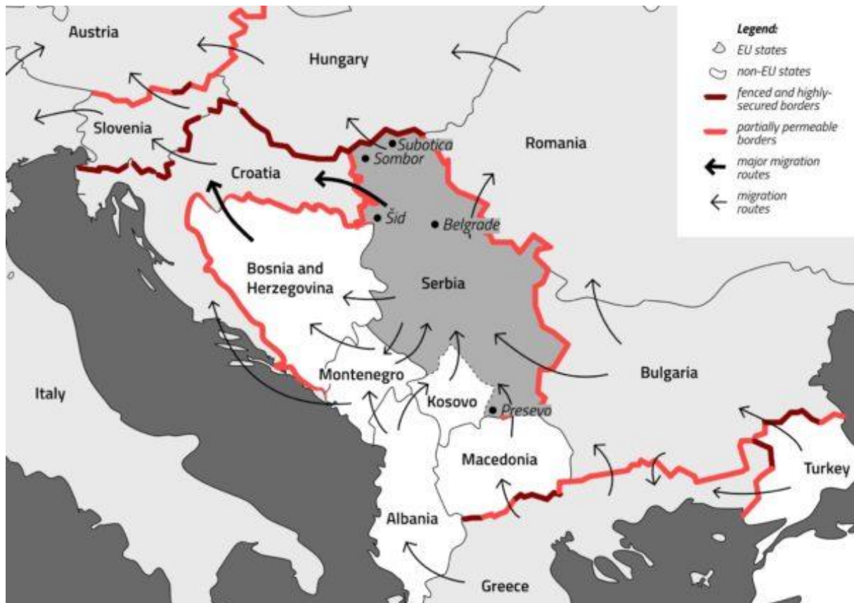
1. térkép: A balkáni útvonal elágazása 21

Abból, hogy a nyugat-balkáni útvonalon összességében csökkent az irreguláris migránsok száma, még nem következik, hogy a dinamikusán változó, számos elágazásból álló útvonalak valamelyikén ne kerülne sor növekedésre. Jelen esetben is megfigyelhető, hogy ha az egyik útvonal részleges bezárulásával a migránsok máshol próbálkoznak az EU-ba történő bejutással.