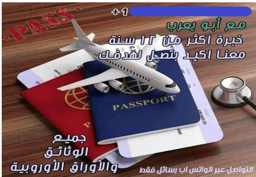
A hirdetés szövege: „Abu Ja'arubbal! Több mint 12 évnyi tapasztalat. Veliünk biztosan eléred a célod. Mindenféle európai irat és igazolvány!

Továbbá más embercsempészeket is reklámoz, feltehetően egy bűnözői csoportról van szó: