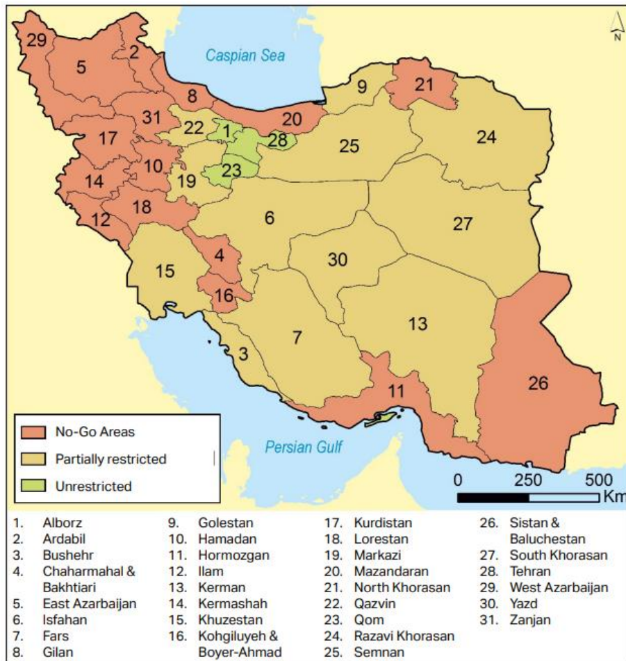
Figure 3.1. Restricted areas ("no-go areas") in Iran, in which Afghans and other foreign nationals are not entitled to live or travel without specific permission.

2. ábra: Irán „afgánmentes” tartományai: a barna és terrakotta színnel jelölt iráni tartományokba afgán és más külföldi állampolgárok csak különleges engedéllyel utazhatnak be vagy telepedhetnek le 47