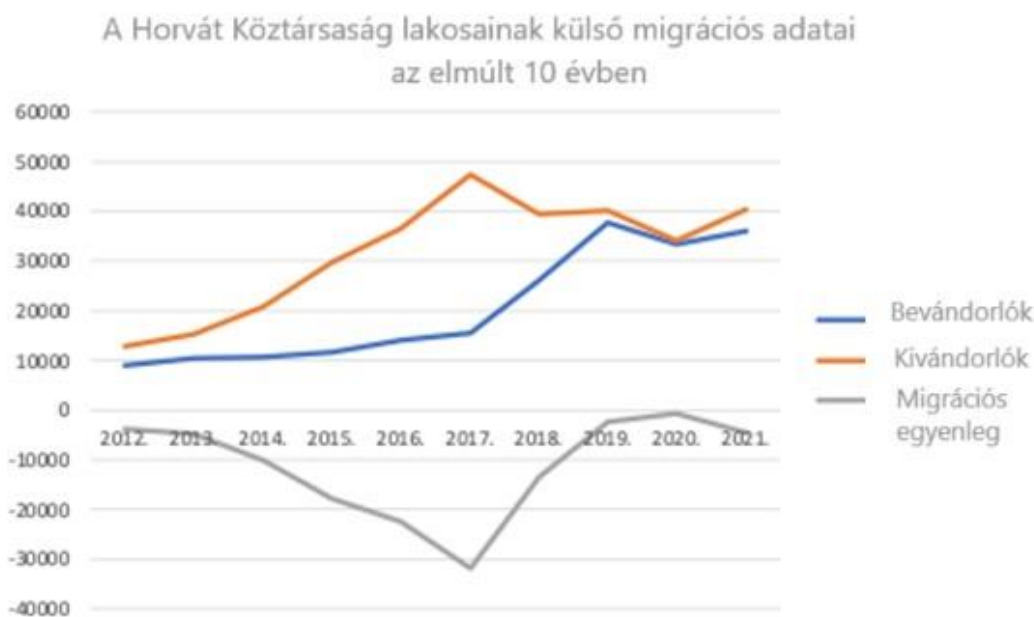
3. ábra: A Horvát Köztársaság lakosainak külső migrációs adatai az elmúlt 10 évben