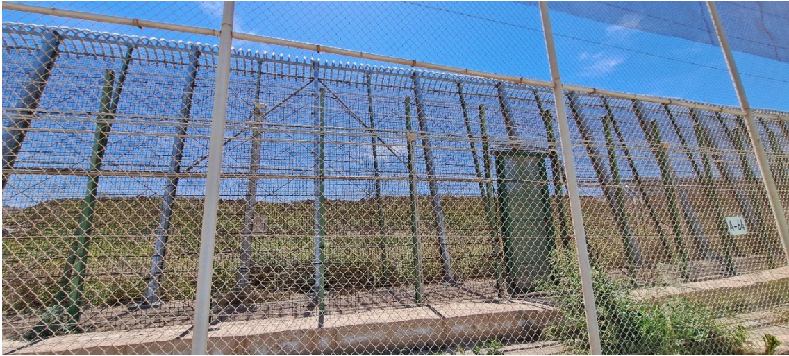
4. ábra: A melillai hármás kerítésrendszer egy szakasza, a marokkói oldalra nyíló ajtóval