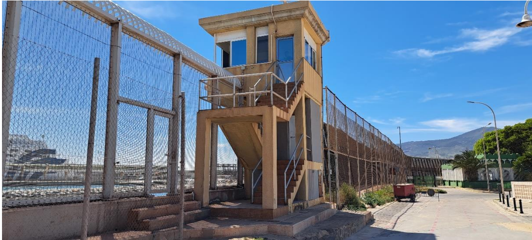
1. ábra: A melillai kerítésnek a melillai Playa de la Hípica-t a nadori kikötőtől elválasztó szakasza 2023. március 31-én.