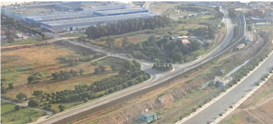
6. ábra: A melillai kerítés egy szakasza a levegőből 2023. március 30-án.