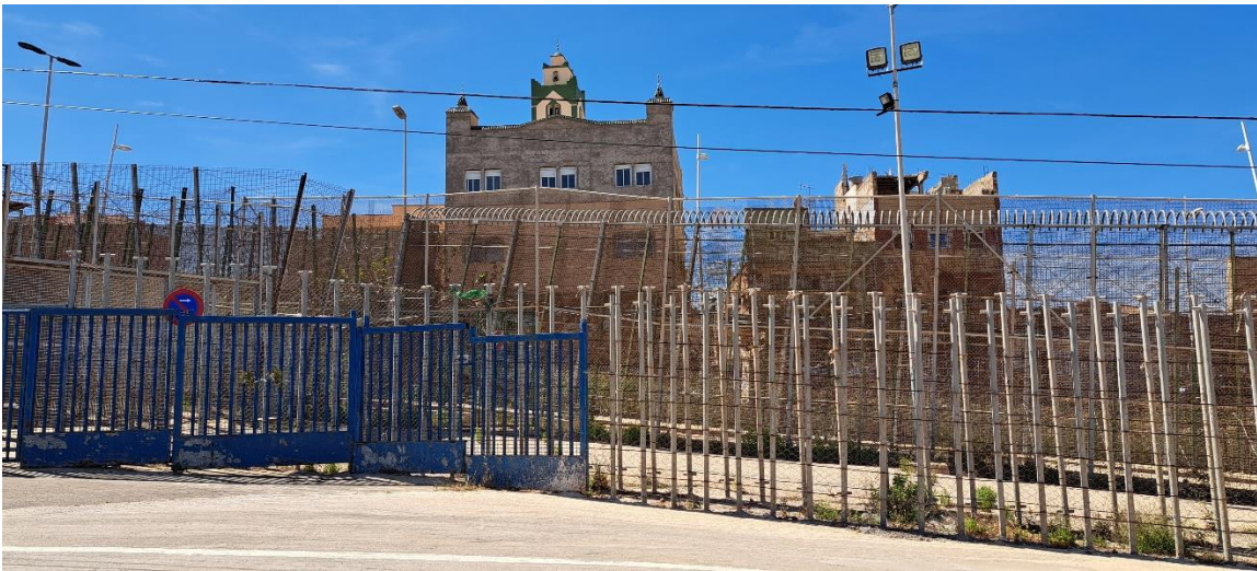
5. ábra: A melillai kerítés Barrio Chino-i határátkelőnél lévő szakasza 2023. március 31-én. Itt történt 2022. június 24-én a 37 halálos áldozatot követelő tragédia.