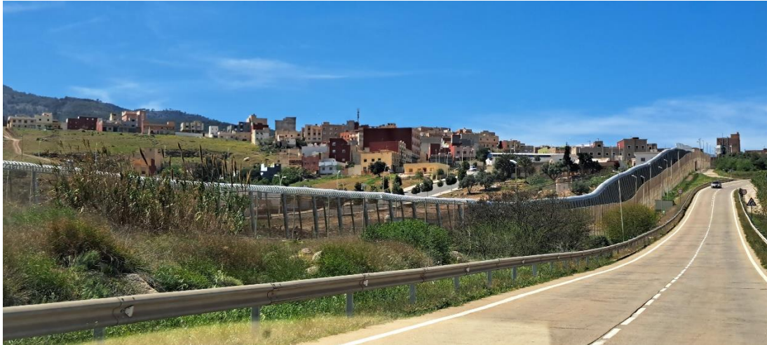
2. ábra: A melillai kerítés egy szakasza 2023. március 31-én.