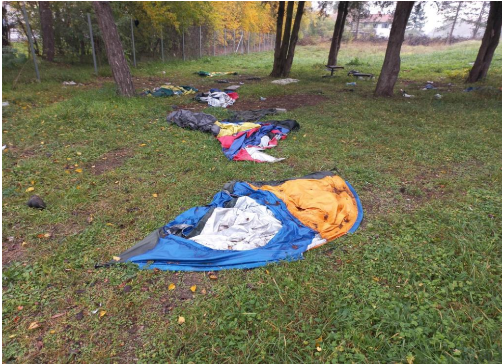
3-8. fénykép: A 2022 nyár végén a szerb hatóságok által felszámolt Horgos-2 illegális táborok