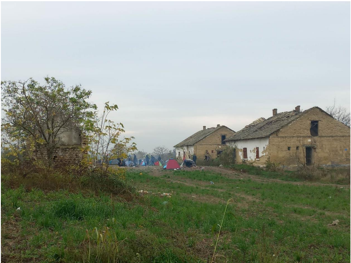
14. fénykép: A felszámolt Horgos-2 tábort követően alapított, a Szabadka-Szeged vasútvonal nyomvonalához közeli, Horgos külterületén található tábor

A magyar műszaki határzáron 6 történő átlépés módjával kapcsolatos kérdéseinkre rámutattak az egyik épület mellé fektetett alumíniumlétrára. Arról eddig is rendelkezünk ismerettel, hogy ez a legnépszerűbb illegális határátkeléses módszer, azonban korábban a bevándorlók táborhelyein még nem láttunk létrát. Az illegális határátkeléssel többségük már többször próbálkozott, elmondásuk szerint átlagosan 4-5-ször.