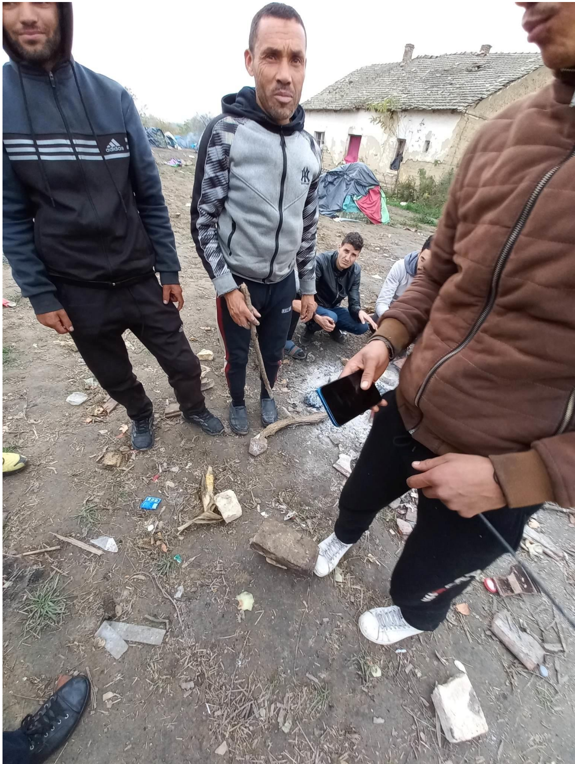
13. fénykép: A felszámolt Horgos-2 tábort követően alapított, a Szabadka-Szeged vasútvonal nyomvonalához közeli, Horgos külterületén található tábor néhány lakójáról hozzájárulásukkal készült fotó