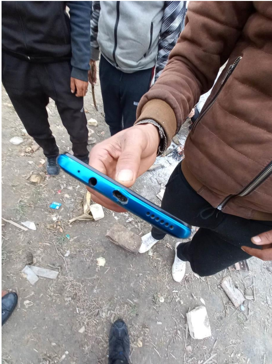
12. fénykép: Horgosi táborlakó migráns megmutatja megrongált töltőfészékű mobiltelefonját

Az itt táborozók leginkább azt sérelmezik, hogy állításaik szerint a magyar rendőrök bántalmazzák őket. Botos verést, kegyetlen bántalmazásokat említettek. Emellett kifogásolták, hogy elveszik a pénzüket, valamint megrongálják mobiltelefonjaik töltéscsatlakozóját. Ezen állítások valóságtartalmát nem tudtuk ellenőrizni.