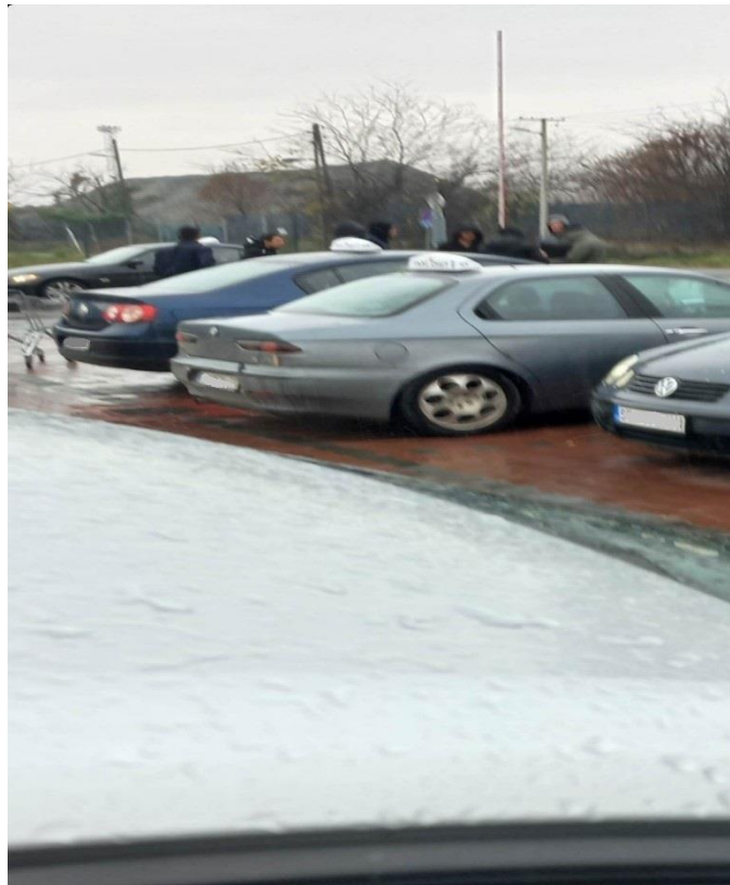
16. fénykép: Helyi taxisokkal egyezkedő migránsok a Lidl parkolójában – Fotó: Tárik Meszár

Szabadka központi részén, a vasútállomás közelében, a Pap Pál utcai Lidl élelmiszerhálózathoz tartozó üzlet és parkolója a migránsok által intenzíven látogatott hely. Korábban vettünk fel már itt interjúkat, azonban a november 16-i látogatás során tapasztalható nyirkos, esős időjárás miatt csak egy kisebb csoport tartózkodott a helyszínen, akik éppen a taxisokkal diskuráltak, aminek okán ezen alkalommal nem kezdeményeztünk beszélgetést.