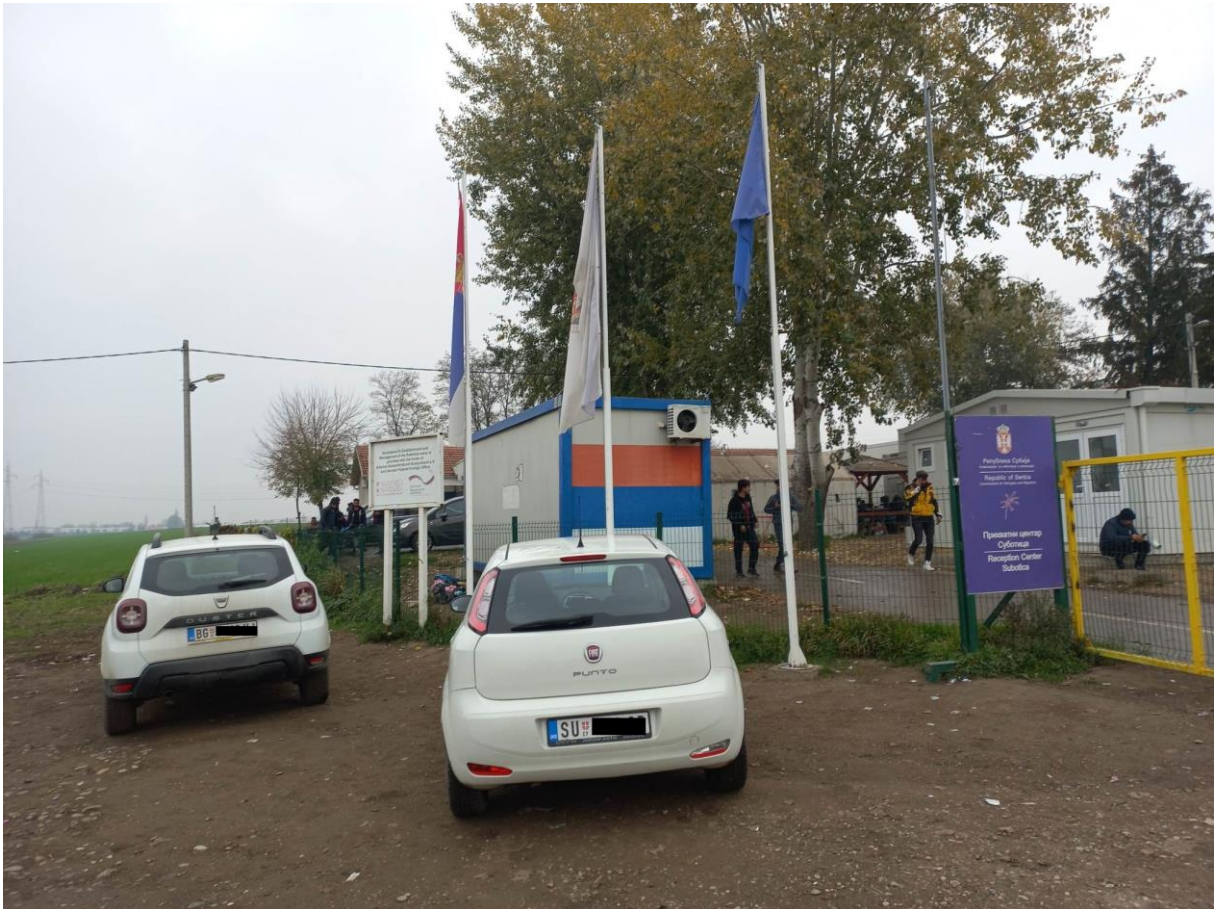
15. fénykép: A szabadkai befogadóállomás bejárata

migránssal is beszélünk, aki előadta, hogy eljutott Ausztriába és időpontot is kapott már az osztrák menekültügyi hivataltól, azonban egy kirándulás alkalmával rossz vonatra szállt fel és Magyarországon kötött ki. Ezt követően a magyar rendőrök a déli határhoz szállították. A papírjait viszont elvesztette Ausztriában. (Egyedül az ő története volt olyan, amely nem tűnt számunkra életszerűnek, de értelemszerűen kizárni sem tudjuk, hogy valós a beszámolója.)