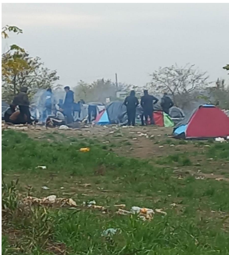
11. fénykép: A felszámolt Horgos-2 tábor követően alapított, a Szabadka-Szeged vasútvonal nyomvonalához közeli, Horgos külterületén található tábor

A másik – jelenleg is szintén aktív táborhely – a nyár végén felszámolttól déli irányba, légvonalban alig egy kilométerre a korábbi táborhelytől épült ki; a Szabadka-Szeged vasúti pálya déli oldalához közel, Horgos település külterületén, elhagyatott, romos épületek mellett. Becsléseink szerint körülbelül 150 fős sátoztábor hoztak ott létre. Egy mintegy 10 főből álló marokkói csoporttal beszélgettünk, valamint egy Rakkából érkező szíriaival és egy bagdadi irakival. Elmondásuk szerint még tunéziaiak és líbiaiak tartózkodtak a táborban.