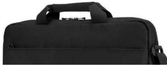
1. ábra

A szerb nyelvű Facebook-bejegyzés 9 fordítása: