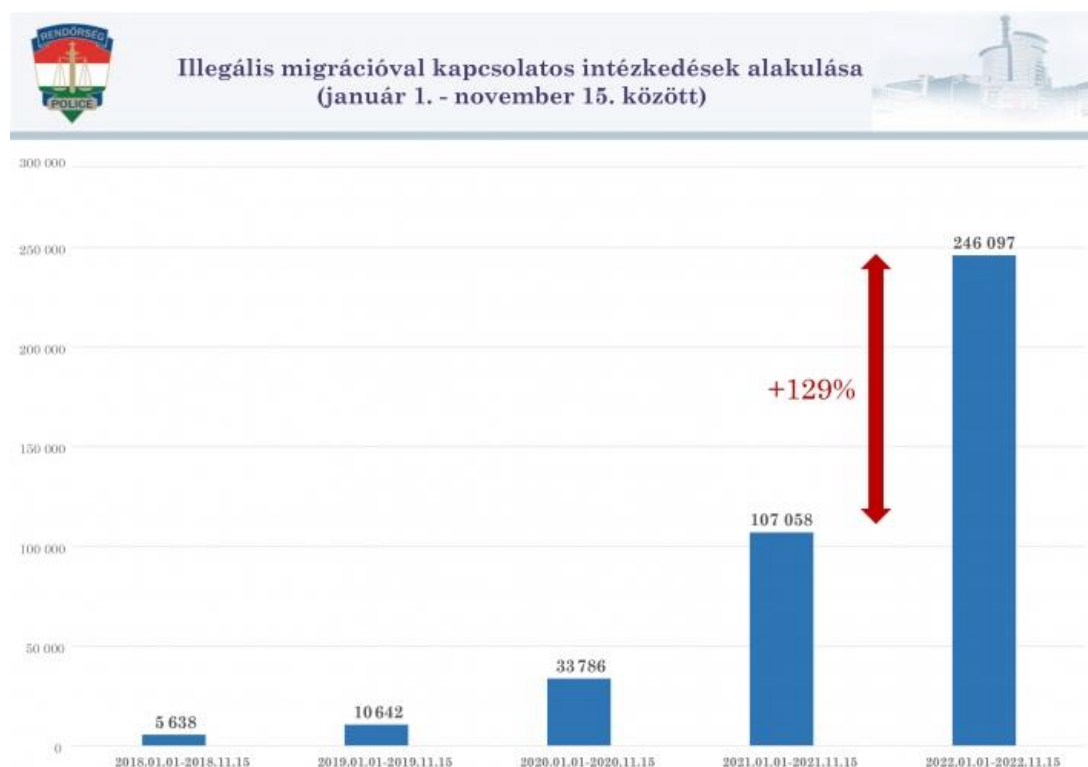
2. ábra: Illegális migrációval kapcsolatos intézkedések számának alakulása 8

amellyel ha kell, »Lőjétek a rendőröket!« 6 Az eset precedens nélküli, ugyanis Magyarország területén efféle akció még nem zajlott migránsok miatt. Igaz, hogy januárban például egy litván rendszámú autó sofőrje szándékosan próbált elütni egy rendőrt a harkai határátkelő környékén, augusztusban többször baleseteztek bevándorlókat szállító csempészárművek és november 14-én egy migránsokat szállító Porsche Zsana közelében egy farakásnak ütközött, ám tűzharc kialakulására még nem volt példa. 7 Fontos aláhúzni, hogy jellemzően nem a bevándorlók követik el ezeket a bűncselekményeket, hanem rendszerint a rendőri intézkedéstől tartó kétségbeesett embercsempészek folyamodnak efféle eszközökhöz. A sarokba szorított embercsempészek tehát veszélyesebbek és kiszámíthatatlanabbak, emlékezzünk csak vissza 2020 októberére, amikor egy migránscsempész kézigránáttal robbantotta fel magát. Az is megfigyelhető, hogy minél több bevándorló éri el Európa és Magyarország határait, annál többször kell a magyar hatóságoknak illegális migrációval kapcsolatos intézkedéseket fogantatosítani, továbbá az embercsempészet és jogellenes tartózkodás elősegítése kapcsán felmerülő bűncselekmények száma is megugrott 2022-ben (lásd 2. ábra).