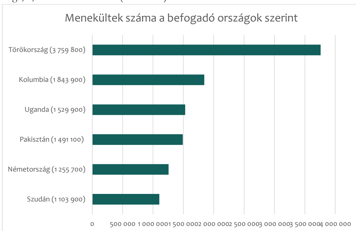
1. ábra A menekültek száma a befogadó országok szerint.

Törökország 2021-ben is a világ legnagyobb menekülteket befogadó országa maradt: a 2021-es év végén több mint 3,8 millió menekült élt ott, ami a globálisan határokon túlra kényszerült emberek 15 százaléka. Őt követi Kolumbia 1,8 millió, Uganda 1,5 millió, majd Pakisztán több mint 1,4 millió fővel. Németország volt az európai Unió legnagyobb menekültfogadó országa, 1,3 millió menekülttel (5 százalék).