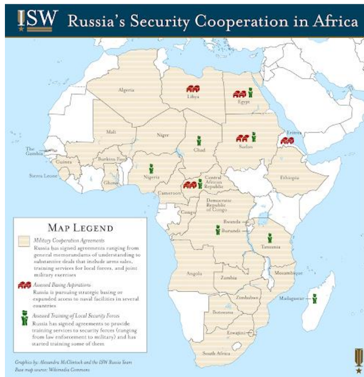
5. ábra Oroszország aktuális afrikai partnerei 70

Fontos megvizsgálni, hogy miért vonzó a szubszaharai országok számára Oroszország. Moszkva együttműködő és partneri hozzáállást tanúsít, amely szimpatikusabb azon afrikai vezetőknél, akik leereszkedőnek érzik a nyugatiak hozzáállását