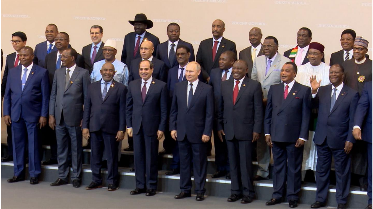
3. ábra A szocsi találkozó meghívott vendégei az orosz elnök társaságában 41