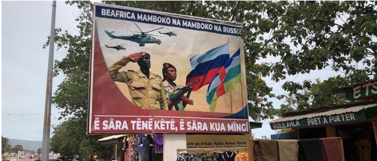
2. ábra A közép-afrikai-orosz kapcsolatokat népszerűsítő plakát Bangui belvárosában 28

Burundiban egész más a helyzet. Az országban jelen van a Wagner-csoport és a Patriot is, előbbi katonai, utóbbi pedig rendészeti feladatokat végez. 29 Egy egészen új modell kikísérletezését tapasztalhatjuk itt, melyben Oroszország magánhadseregei által kívánja segíteni az ország közszolgálati feladatainak ellátását. Egy 2019-es Telekanal Dozhd interjújában egy meg nem nevezett védelmi minisztériumi alkalmazott úgy nyilatkozott, a Burundiban állomásozó PMC-k pusztán egy orosz katonai bázis építésének felügyeletében segédkeznek. 30 A tisztviselő szerint a Patriot elnevezésű PMC-t egyszerre többen finanszírozzák, így a Külügyminisztérium, a légvédelmi erők és az orosz titkosszolgálat is. 31